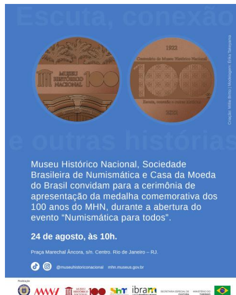
Figura 2. Convite da cerimônia de apresentação da medalha comemorativa dos 100 anos do MHN.

A produção e o lançamento de uma medalha comemorativa dos 100 anos do museu foram uma ação proposta pela Sociedade Numismática Brasileira, que contou com o apoio da Casa da Moeda do Brasil e que produziu uma série de medalhas, sendo uma doada ao museu e as demais sendo disponibilizadas para aquisição do público colecionador.