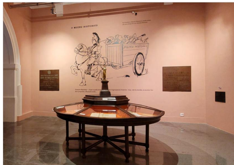
Figura 10. Módulo sobre o Museu Histórico Nacional. Ao fundo a charge de Kalixto criticando a escolha de Gustavo Barroso para diretor da nova instituição, em 1922. Ladeando a charge, duas placas que ladeavam a entrada principal do MHN na década de 1940. No primeiro plano, vitrine usada nas primeiras exposições do MHN.

Aliás, todas as cores dessa exposição são em tons pastéis, contrastando com cores vivas usadas na forragem das vitrines. Enquanto o branco, o azul, o amarelo e o verde remetem às cores da bandeira do Brasil independente há 200 anos, o rosa confere identidade ao Museu centenário que conta a sua história lembrando ações, como a publicação dos Anais do MHN desde 1940, mas também fazendo autocrítica, como ao publicar uma charge de Kalixto da época de criação do MHN, ridicularizando o feito do presidente Epitácio Pessoa e o intelectual escolhido por ele para dirigir a nova instituição. Aliás, as cores, assim como a tipografia, foram escolhidas a partir de referências de anúncios publicitários com desenho inspirados no estilo Art Nouveau, presentes no Livro de Ouro. A profusão e a beleza desses anúncios fizeram com que eles também fizessem parte da exposição.