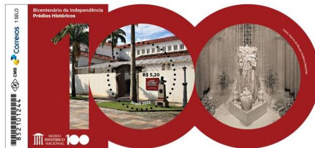
Figura 3. Selo postal comemorativo do Centenário do MHN produzido pelos Correios, 2022.

O projeto “Escuta, conexão e outras histórias” é um marco assumido pelo MHN que pretende inaugurar não só um conjunto de ações cuja elaboração conta com a participação de diversos públicos e é fruto do acúmulo de reflexões e autocrítica que o museu vem adensando nos últimos anos. É uma nova proposta de ser museu dessa instituição centenária, que não pretende se perder no tempo.