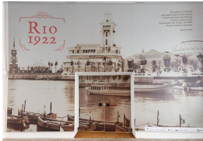
Figura 4. Porta de entrada da exposição Rio-1922 . Foto: Jaime Acioli