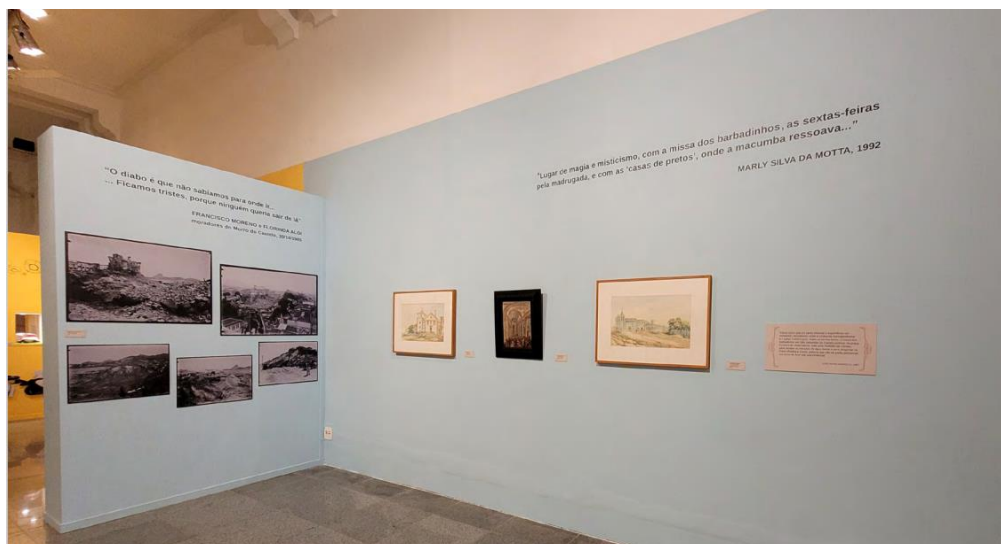
Figura 6. Detalhe do módulo sobre o Morro do Castelo. Vê-se ao fundo pequena parte do módulo "Efervescência carioca".

do Morro, pois, se mirarmos apenas os vestígios preservados no MHN, fragmento do portal do forte, azulejos do convento dos jesuítas, etc., a ideia é que em pleno século XX o Morro fosse ocupado apenas por construções oficiais do projeto colonial. Isso tem a ver com a seleção do que foi interessante na década de 1920, quando o MHN recolheu esses escombros. Atualmente, nos interessa conhecer a história das pessoas comuns, das religiões que foram perseguidas, dos passados silenciados (Trouillot, 2016) em nome de uma história única (Adichie, 2019) que era valorizada no MHN, com ênfase nos grandes feitos do Estado, na exaltação de heróis e na reafirmação de um projeto civilizador colonial, católico.