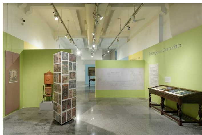
Figura 9. Módulo “Exposição internacional comemorativa do Centenário da Independência do Brasil”. À esquerda, o totem interativo com as propagandas publicadas no Livro de ouro da Exposição . À direita, a vitrine contendo objetos relativos à Exposição .

Já o verde coloriu o módulo sobre a Exposição internacional comemorativa do Centenário da Independência do Brasil , com a reprodução de planta oficial do evento indicando o espaço da cidade ocupado pela mostra, todos os pavilhões e demais atrações que ficaram abertos ao público entre 7 de setembro de 1922 e 24 de julho de 1923. Esse núcleo contou ainda com uma vitrine com bottons... e a mostra de objetos relativos ao evento, como um baralho “souvenir”. Dois vídeos ... e um totem interativo com as propagandas da época que foram publicadas no Livro de ouro da Exposição do Centenário .