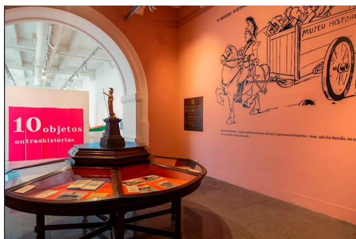
Figura 11. Passagem do módulo sobre o MHN para a exposição 10 objetos: outras histórias . As cores fortes, a tipografia e outras escolhas do projeto expográfico se deram na perspectiva

Por isso, aprofundando a abordagem sobre o Museu Histórico Nacional, foi produzida a exposição 10 objetos: outras histórias . Focando mais na trajetória da instituição centenária, o questionamento era direcionado à história dos objetos e à que os objetos contavam, contam ou ainda podem contar no museu. Então o visitante atravessa o portal de uma sala em rosa pastel para entrar numa exposição cujo título está gravado em placas rosa-choque. É como se estivesse sendo transportado do passado para o presente.