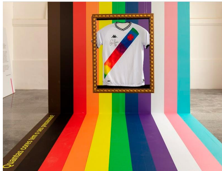
Figura 12. Exposição da camisa “orgulho LGBTQIA+” do Clube de Regatas Vasco da Gama, com autógrafo do então capitão do time, Germán Cano, 2019. Como todos os objetos dessa mostra, uma pergunta provocativa precede todo tipo de informação e explicação sobre o objeto: “Quantas cores tem o seu preconceito?”